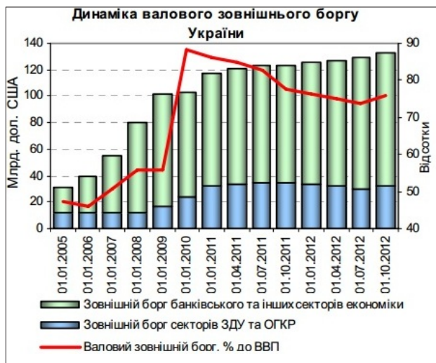
Рис. 1. Динаміка валового зовнішнього боргу України

Основним чинником зростання номінального обсягу зовнішнього боргу в поточному році (на 6,2 млрд дол. США) є значні залучення підприємств реального сектору економіки.