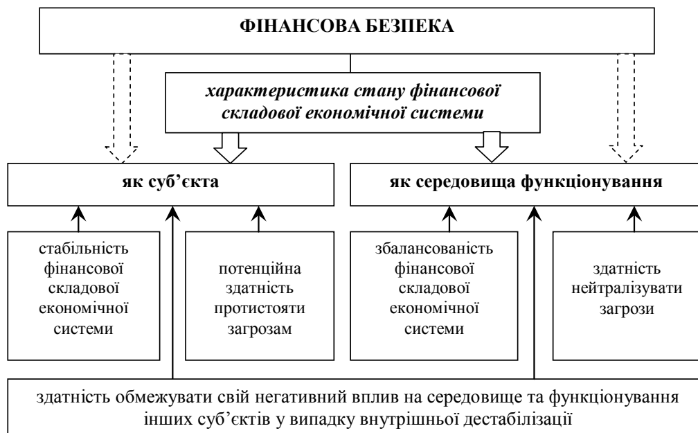
Рис. 2. Базові ознаки фінансової безпеки

Узагальнення розглянутих ознак фінансової безпеки наведено на рис. 1.