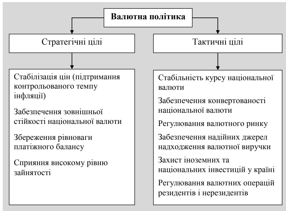
Рис. 1. Основні цілі проведення державою валютної політики

У загальному вигляді основні цілі валютної політики представлені на рис. 1.