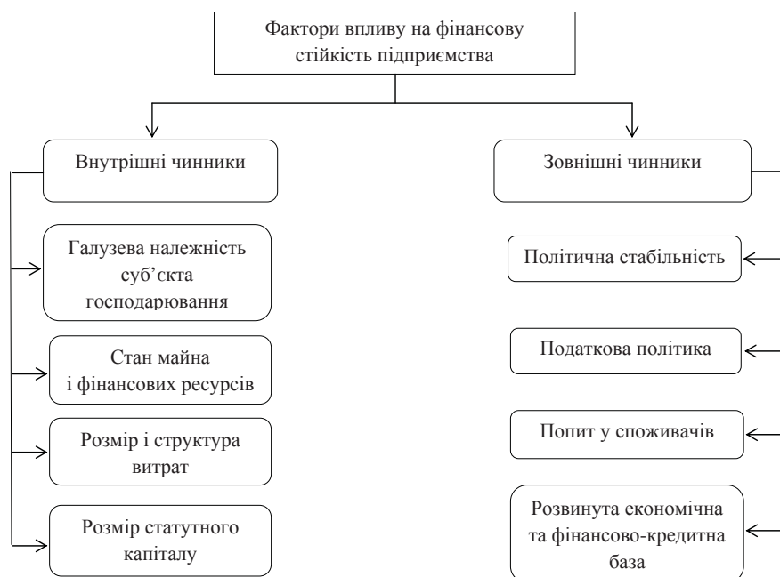
Рис. 2. Фактори впливу на фінансову стійкість підприємства

Загалом, основні фактори впливу на фінансову стійкість будь-якого підприємства представлено на рис. 2.